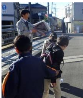
現地で、被災状況(写真)と復興状況の話を聞きます。

詳しくは、広報みなと9/1号または、9月上旬頃に皆様へお配りする募集チラシをご覧ください。